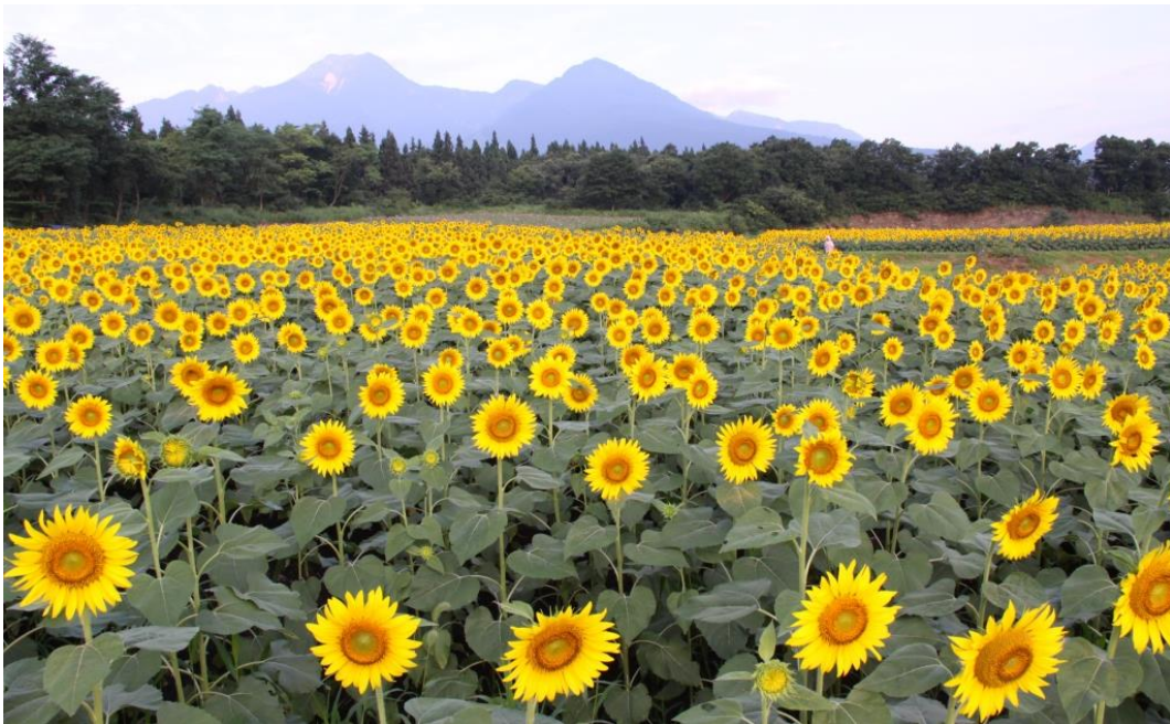
【 大洞原のひまわりと秀峰妙高山 】

向夏の候、会員の皆様におかれましては、ますます御清祥のこととお喜び申し上げます。また、学校運営の中核として日々その職務遂行にあたっておられることに心から敬意を表します。